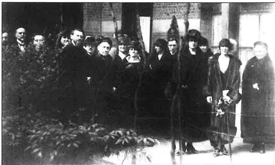
Fig. 19. - Koningin Elisabeth bezoekt de kliniek in 1925

In de Meistraat werden een aantal jubilea gevierd meestal gepaard gaande met het bezoek van vooraanstaanden.