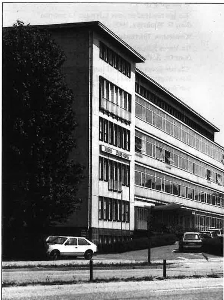
Fig. 21 Kliniek Louise Marie 1980

De geestelijke en materiële erfenis van de "Dames de la Charité" leeft echter verder in het nog bestaand vzw "Centrum Louise-Marie" en de vzw "Stichting Constance Teichmann", die zich verder zullen bezighouden met het ondersteunen van noodlijdenden te Antwerpen en in de wereld.