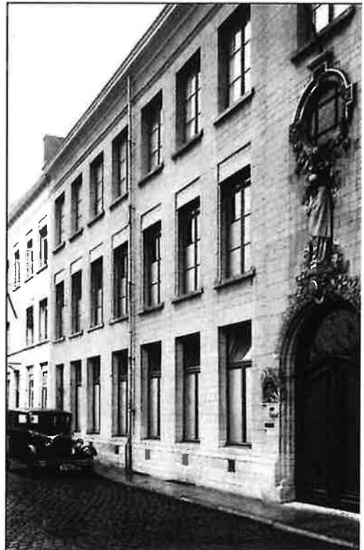
Fig. 18. - De Kliniek Louise-Marie in de Meistraat

Een aantal prentbriefkaarten geven ons een idee hoe het er daar uitzag.