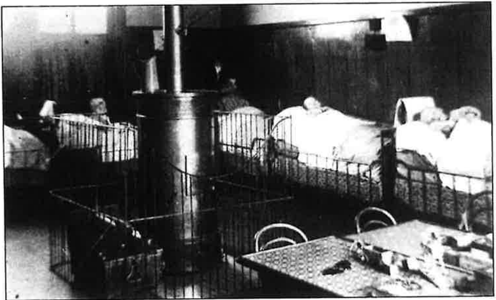
Fig. 6. - Opname van een kinderzaal, waarschijnlijk uit de periode dat de kliniek

Het avondmaal bracht de hele familie bijeen, waarna Constance haar drukke correspondentie afwerkte.