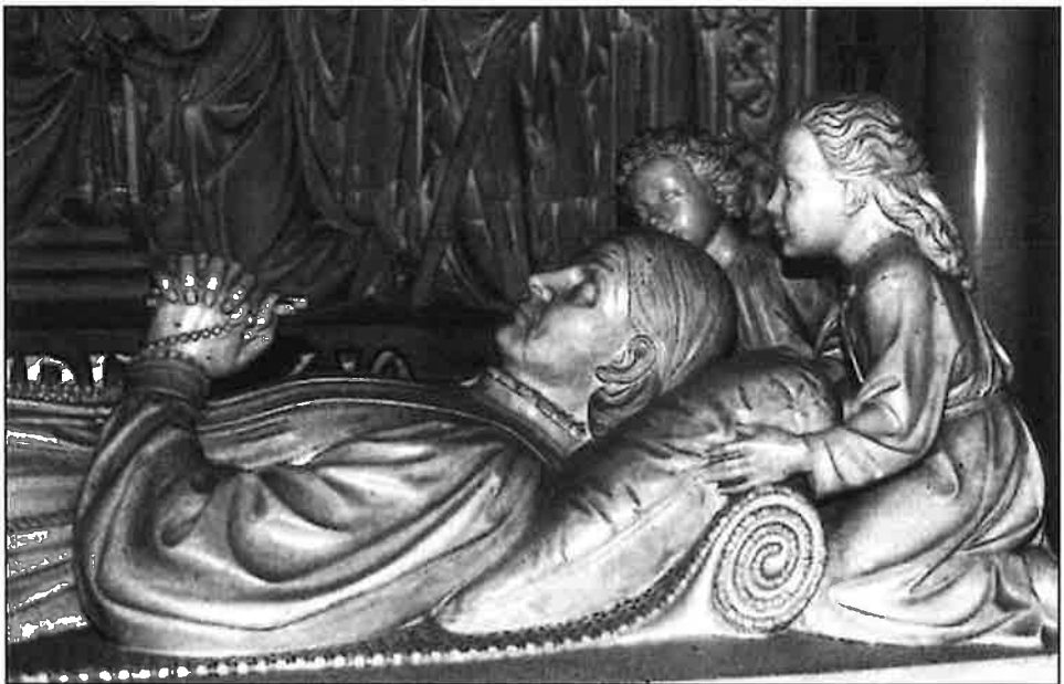
Fig. 17. - Het afdalen van Constance Teichmann