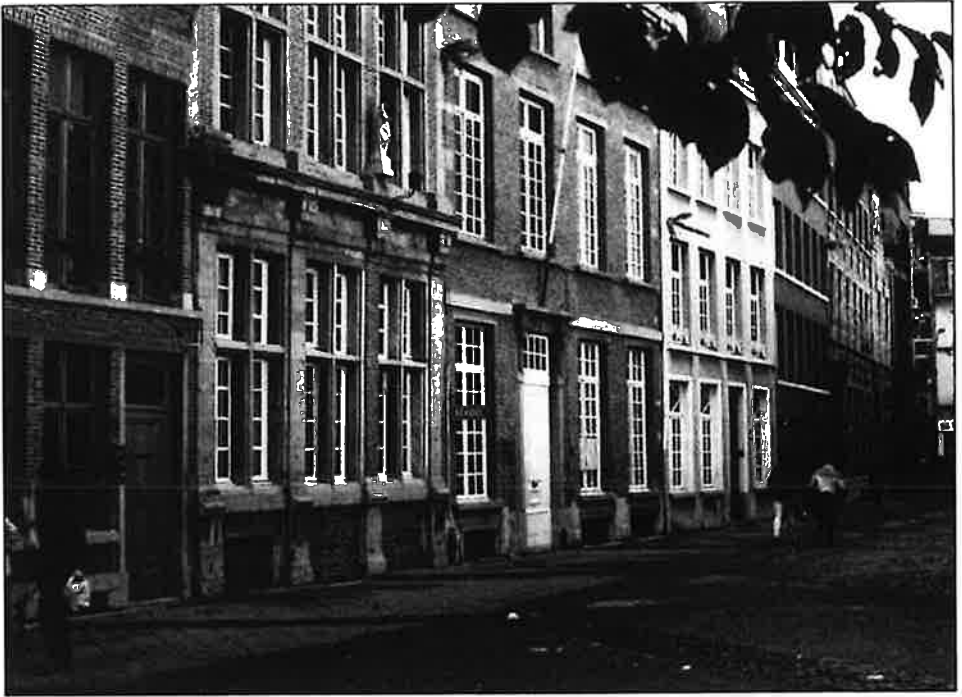
Fig. 8. - Het tweede gasthuis in de Everdijstraat (1851-1877)

Men kent echter het dramatische verloop van dit verhaal. Keizer Maximiliaan werd terechtgesteld en Keizerin Charlotte vluchtte naar België, waar spoedig de eerste tekenen van een fatale verstandsverbijstering konden worden vastgesteld.