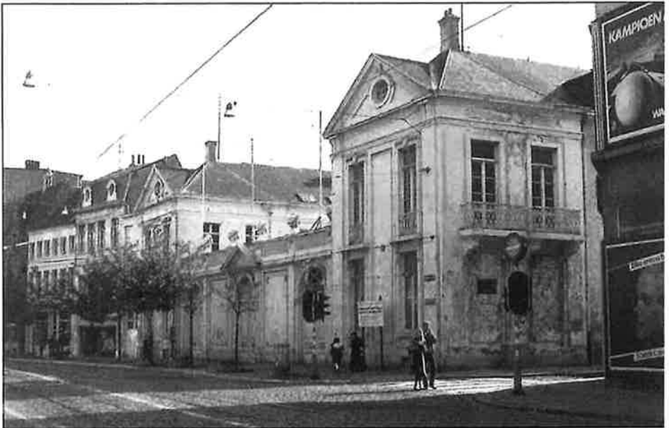
Fig. 3. - Ambtswoning van de gouverneur

Tijdens de periode van het vaderlijke gouverneurschap woonde de familie Teichmann in de toenmalige ambtswoning van de gouverneur op de Schoenmarkt (schuin tegenover de later gebouwde Boerentoren).