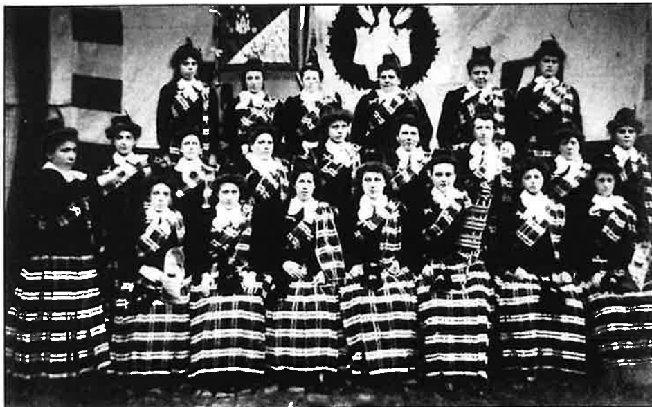
Fig. 10. - De "Liefdadige Vrouwen" (gesticht in 1892) in vol ornaat