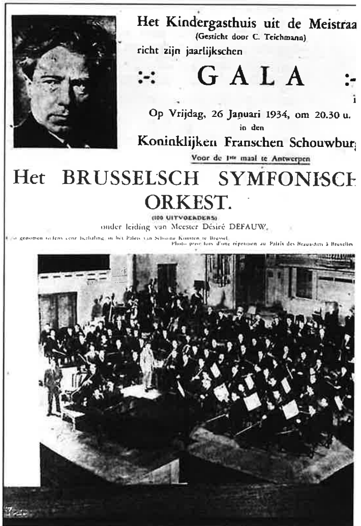
Fig. 20. Aankondiging voor een gala- concert in 1934

Een dergelijke tijd bood aan een figuur als Constance alle kansen tot ontplooiing.